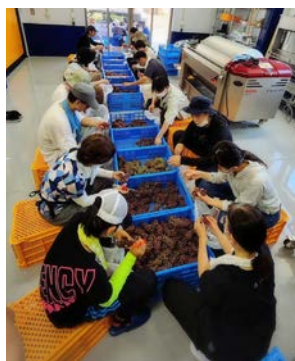
ブドウの選定作業風景