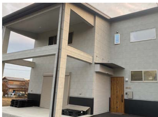
奈良県香芝市に設立された木谷ワイン