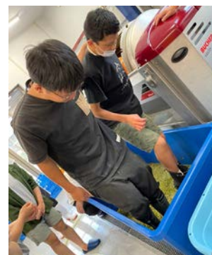
ブドウの足踏み作業風景

栽培醸造家の想いを詰め込んだワイナリーのロゴマーク。 グラフィックに顕されているのは3つの要素