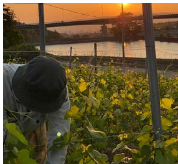
木下ワインの園場