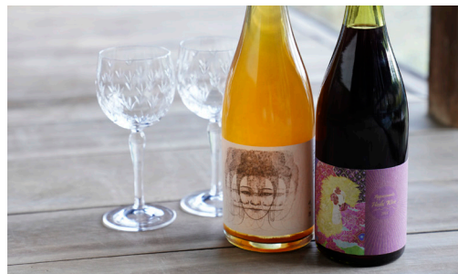
ドメヌヒデ×若佐慎一ラベルデザインの日本ワイン