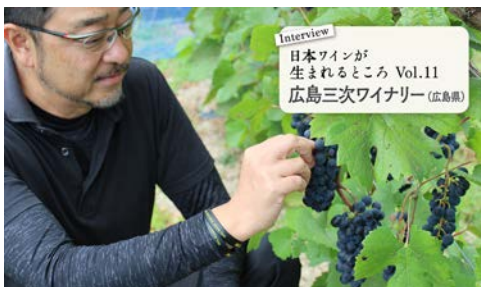
Interview 日本ワインが 生まれるところ Vol.11 広島三次ワイナリー (広島県)

シリーズ・日本ワインが生まれるところ。 広島『広島三次ワイナリー』にインタビュー！