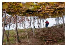
合名山（ごうめいやま）全体に位置する、カタシモワイナリー圃場