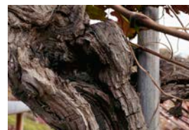
樹齢100年以上の甲州ブドウの幹