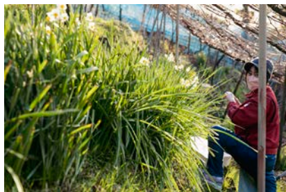
デラウェア品種を栽培している宝吉畑

「放棄地（ほうきち）」を、吉を呼ぶ宝の畑「宝吉（ほうきち）畑」へ。 地域の抱える問題と取り組む「カタシモワイナリー」の想いを、美味しいワインで応援。