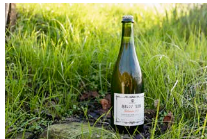
宝吉畑のデラウェアから誕生した、wa-syu限定醸造ワイン

「カタシモワイナリー」では、SDGsが叫ばれる以前から地場産業の衰退や高齢化による耕作放棄地の急増などで抱える問題について取り組みをおこなっています。その一貫として立ち上げた「宝吉畑プロジェクト」のひとつとして、「放棄地（ほうきち）」をおめでたい「宝吉（ほうきち）」と呼び、「吉を呼ぶ宝の畑＝宝吉畑（ほうきちばたけ）」として活用する持続可能な取り組みを進めています。今回、wa-syu限定醸造としてリリースされたスパークリングワインは、この宝吉畑で生まれたデラウェアを100%使用。種なしにするためのジベレリン処理や除草剤なども使わずにのびのびと育った果実が、華やかな果実の香りを放ちます。オレンジワインの醸しの技が、鮮やかなオレンジ色と心地よい苦みをもたらし、より余韻の長い味わいを生み出しています。耕作放棄地を荒地や宅地にしないように「吉を呼ぶ宝の畑」に蘇らせることは、地域の景観を守り、柏原地区のワインの価値を上げることにも繋がっています。