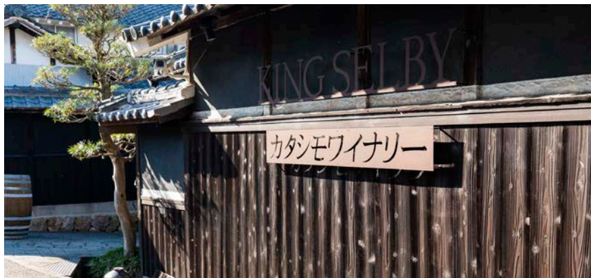
大阪府柏原市に位置する、創業1914年のカタシモワイナリー