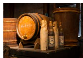
柏原市指定有形民俗文化財の道具