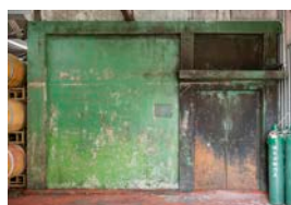
登録有形文化財の貯蔵庫

「カタシモワイナリー」は栽培の歴史も長く、現在、日本に現存する樹齢100年超えの甲州ブドウはわずか5本とされていますが、そのうちの4本は「カタシモワイナリー」の圃場で大切に育てられています。また、ワイナリー敷地内には、国の登録有形文化財に指定されている貯蔵庫や、柏原市指定有形民俗文化財に指定されているワイン造りの歴史ともいえる明治～大正時代の醸造器具 35 点が現存しています。