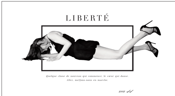
LIBERTÉ — 自由 —