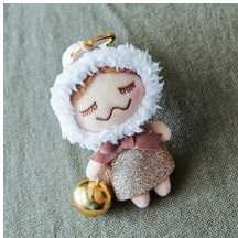
JINGLE BELLS RINKACHAN Period 2013 ジングルベルリンカチャン ¥1,000 (+tax)

2013年秋に発売されたハロウィンバージョン第2弾の RINKACHAN。この年はリンカチャンがウサギに仮装。遊び心がファンにはたまらないユニークなおぼけの着せ替え付き。