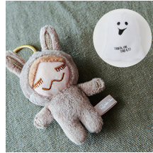
HALLOWEEN RINKACHAN '13 Period 2013 ハロウィンリンカチャン '13 ¥1,000 (+tax)

2012年秋に発売されたハロウィンバージョンの RINKACHAN。リンカチャンが大きなかぼちゃを持ったヒョウに仮装しました。首についたリボンが可愛い。