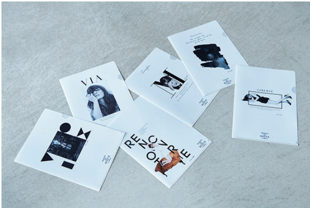
クリアファイル 各¥450 (+tax)