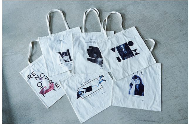
トートバッグ 各¥3,000 (+tax)