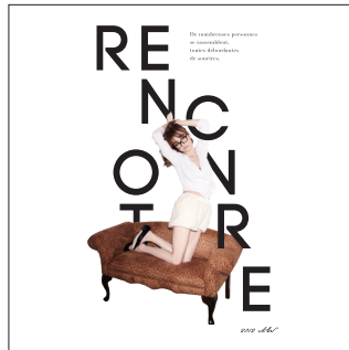
RENCONTRE — 出会い —