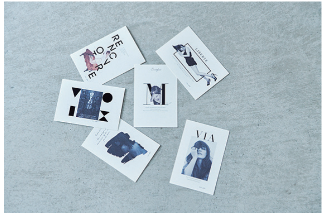
ポストカード 各¥270 (+tax)

商品詳細はこちら： https://www.maisondereefur.com/webshop/goods?fic=graphic