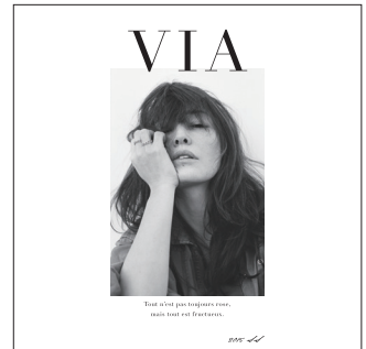
VIA — 経て —