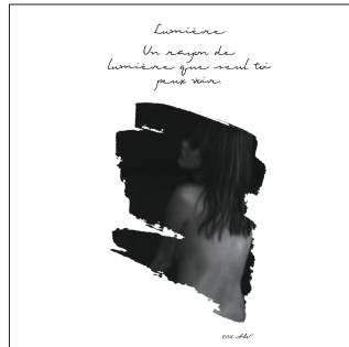
LUMIÈRE — 光 —