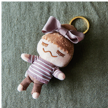
OPEN SPECIAL RINKACHAN Period 2012 オープンスペシャルリンカチャン ¥1,000 (+tax)

2012年春に発売された MAISON DE REEFUR オープン記念の RINKACHAN。トレードマークのおだんごヘアに、大人可愛い象徴でもある大きなグログランリボンがポイント！一大ブームの火付け役！