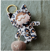
HALLOWEEN RINKACHAN '12 Period 2012 ハロウィンリンカチャン '12 ¥1,000 (+tax)

2012年夏に発売された夏バージョンの RINKACHAN。ギンガムチェックのピキニが夏らしくてキュート！7月に開催される「ジュンの縁日」にて会場限定で販売！