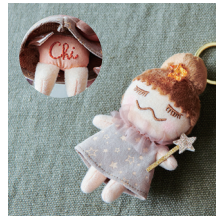
TWINKLE STAR RINKACHAN Period 2016 トゥインクルスターリンカチャン ¥1,000 (+tax)

2013年冬に発売されたクリスマスバージョンの RINKACHAN。帽子についたポンポンと、手に持ったベルがとってもキュート。クリスマスツリーのオーナメントにもおすすめ。