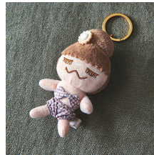
TOKONATSU RINKACHAN Period 2012 トコナツリンカチャン ¥1,000 (+tax)

2012年春に発売された MAISON DE REEFUR オープン記念の RINKACHAN。トレードマークのおだんごヘアに、大人可愛い象徴でもある大きなグログランリボンがポイント！一大ブームの火付け役！