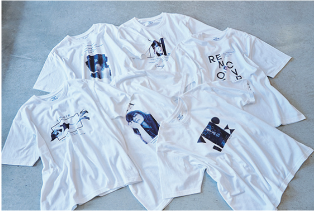
Tシャツ 各¥5,000 (+tax)