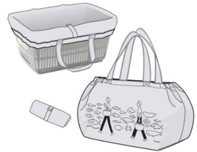
オリジナルエコバック ※画像はイメージです

認定NPO法人 グリーンバード ( http://www.greenbird.jp/ )