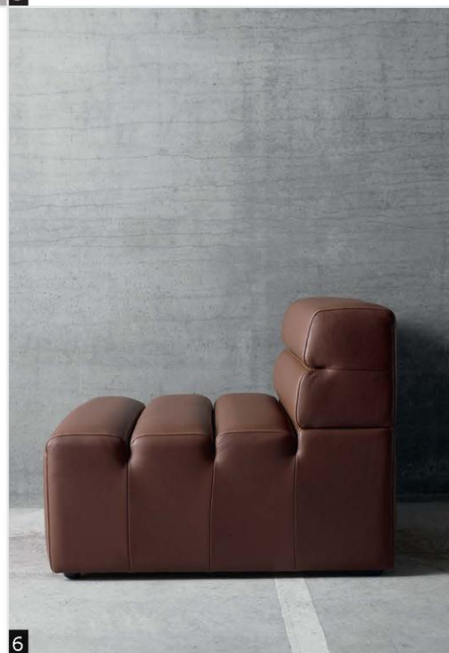
Photo 6: チェア、各種ファブリック・レザーあり。写真は、¥186,500 H72xW72xD90cm。 ¥98,500 より

Photo 5: smartville(スマートヴィル) チェア、回転ベース付。リクライニング機能付もあり。H112xW66xD76cm ¥179,500 より