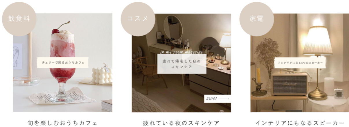
旬を楽しむおうちカフェ