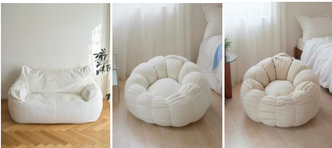
HUGME 2人掛けビーズソファ IVORY

また、コンパクトなサイズ感とお花のような見た目が特徴の「ANEMONE(アネモネ)」シリーズのビーズソファもLOOSYの人気商品です。