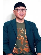
特撮美術デザイナー・三池敏夫氏