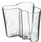
アルヴァ・アアルト コレクション ベース 120mm バブル クリア

※Artek Tokyo Store にて 8 月～10 月までアルヴァ・アアルト コレクション ベース バブル クリア含むフェアを開催予定