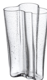
アルヴァ・アアルト コレクション ベース 201mm バブル クリア