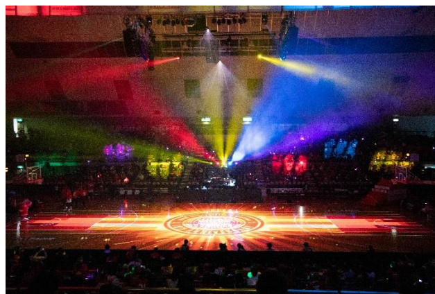
10周年仕様のセンターサークルを鮮やかに演出