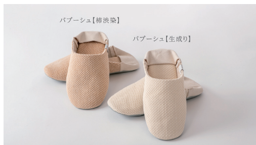
柿渋染め色と生成り色の「バブーシュ」

柔道衣メーカーとして世界中の柔道家から愛されている九櫻。創業100年を迎え、次の100年に向けて九櫻は「武道の九櫻」から「武道を超えた世界の九櫻」へと進化。創業から一貫して生地を自社で織ることにこだわってきました。この「人が肌に触れる生地の中で最も強い生地」を私たちは「九櫻刺子」と名付け様々なコラボやプロダクトで生地の魅力を伝えていきます。好評をいただいた第一弾の黒染 九櫻刺子Tシャツに続き、第二弾は消臭・抗菌作用がある「柿渋染のバブーシュ&スリッパ」を開発いたしました。