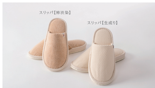
柿渋染め色と生成り色の「スリッパ」