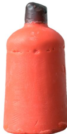
オリーブ収穫祭 ネイキッドシャワージェル (ネイキッドシャワージェル)

お肌を清潔に整えるフレッシュなオレンジ、ベルガモットオイル、ブドウ葉から抽出したエキス、そしてお肌に潤いをもたらす上質なフェアトレードのオリーブオイルをブレンドしたボディソープです。パッケージをなくしネイキッドにすることでプラスチックの削減につながります。