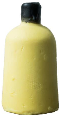
みつばちマーチ ネイキッドシャワージェル (ネイキッドシャワージェル)

プラスチック容器や包装を使用しない、リキッド状のシャワージェルと同じ原材料で作られた固形のボディソープで、既存商品の中で人気を誇るクリアボトルに入ったリキッド状のシャワージェル3種が、ボトルの形となって登場。ラッシュでは、ゴミになるプラスチック包装や容器を使用せずに裸(ネイキッド)の状態の販売できるようリキッド状の商品を固形にする開発を行っています。これにより、環境への負荷軽減はもちろん、合成保存料を不要とすることで人への負荷も軽減することができ、ラッシュの環境に対する考え方のメッセージを、商品を通じて発信しています。