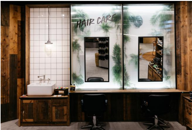
LUSH 神戸三宮店内観イメージ

英国を拠点とし、世界49の国と地域でビジネスを展開する化粧品ブランドLUSH(ラッシュ)は、2018年4月27日(金)、日本最大規模となる路面店「LUSH 神戸三宮店」を、神戸三宮センター街にいよいよオープンいたします。このオープンを記念し、オープン日より連日、様々な体験型イベントを開催する予定です。また、当店以外では購入することができない希少アイテム全11種を数量限定で特別に販売する予定です。