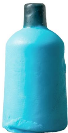
DIRTY スプリングウォッシュ ネイキッドシャワージェル (ネイキッドシャワージェル)

スペアミントとメントールがお肌を心地良くし、爽やかな気分。タイムもブレンドされているので、ハーブ独特のフレッシュな香りを楽しめます。