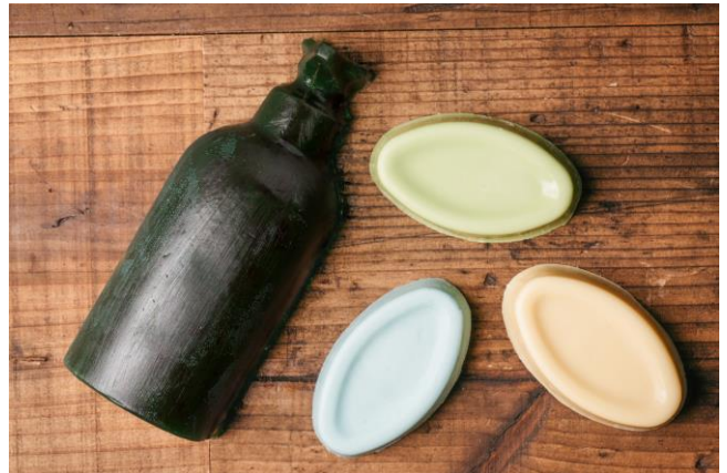
LUSH 神戸三宮店限定アイテム