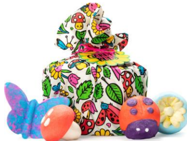
ガーデン パズ (ギフト)

ギフト内容・・・ロージー バタフライ(バスボム)、フローティング フラワー(バスボム)、レディバード(バブルバー)、木の子ちゃん(バブルバー)