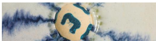
ブレイジン パッド ズーラ (バスボム)