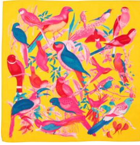
トウイート ユアセルフ ノット ラップ (ノットラップ) 70cm × 70cm

感謝の気持ちをつぶやくのに苦労しているのなら、このノットラップが小鳥のさえずりのような素敵な言葉を見つけて届けてくれるかもしれません。虹色の羽が美しく描かれたデザインは大切な人を喜ばせるギフトをオリジナルでラッピングするのに理想的。