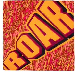
ロアー ノット ラップ (ノットラップ) 100cm × 100cm

忙しいあの人にやっと訪れた休息を邪魔する、厄介なものを包み込むパーフェクトな方法を探している？ それなら、ビッグサイズのノットラップが味方になってくれるかも!? 忙しすぎて忘れてしまう叫びも、優しく包みこみなかったことにしてくれるはずです。