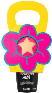
フラワー ポット (ギフト)

Knot Wrapやウェアラブルマスクを含むギフトアイテム全8種を販売開始します。大切なお母さんを豊かな気持ちにしてくれるバスアイテムが詰まったギフトは、中身を使用した後にも、お面や風呂敷などとして繰り返し使用することができます。