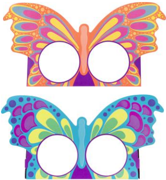
バタフライ マスク ウェアラブル マスク (グッズ)

美しい彩りの「蝶」はバスボムが2個入る、リサイクル可能なギフトパッケージです。さあ、ごみのない世界へと飛び立ちましょう。羽の下にバスボム(入浴料)を2個セットして、あなたの大切な人に感謝の気持ちを込めて贈ってください。中身を使い終わった後は華麗な「蝶」のマスクへと変身します