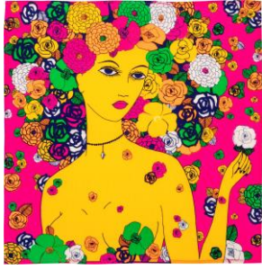
ラブ ユアセルフ ノット ラップ (ノットラップ) 50cm × 50cm

母なる自然に感謝し、このオーガニックコットン製のKnot Wrap (風呂敷)で素敵な魅力を開花させましょう。世界に一つだけギフトをラッピングして、大切な人とあなた自身に喜びの種をまいてください。この一枚の布をリユースする度に二人の間に愛が育まれます。