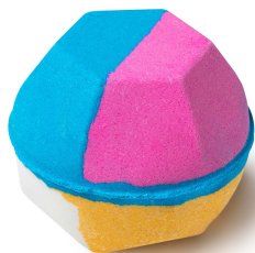
エクスペリメンター (バスボム)

色彩の変化、ふんだんに使われたプラスチックフリーのラメ、あふれるポップングキャンディ、そしてときめく香り。このバスボムはあらゆる側面を持ち合わせています。ハッとするような香りは、温かみと落ち着きを感じるバニラ、そしてウッドィでスモーキーなペチパーオイルがブレンドされています。