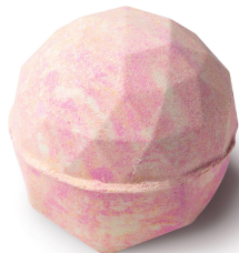
ダイヤモンドダスト ボム (バスボム)

心がときめく、キラキラしたものが大好きな方にぴったりのバスボムです。自然が生み出すダイヤモンドダストの美しく幻想的な風景をバスタブの中で再現しようと、プラスチックフリーのラメを贅沢にミックスしました。ネロリやイランイランの華やいだ香りとミラーボールのような輝きを浴びるバスタイムを。