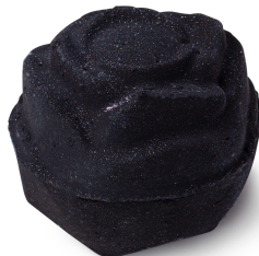
ブラックローズ ボム (バスボム)

ラッシュ史上最もダークなバスアート(湯船をキャンバスにみたくて、バスボムが溶けて描き出す色彩の様子のこと)を楽しめるバスボムです。ダークな色彩とは裏腹に、ローズ、ゼラニウム、レモンをブレンドした、ローズの花びらの上に寝転んでいるような気分になれる甘く華やかな香りは、闇に漂う幻想的な雰囲気をもたらしてくれます。