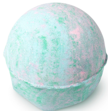
レイクス (バスボム)

豊かな緑と可憐な花々が広がるイギリス湖水地方の心地よい静けさにインスピレーションを受けて作られたバスボムです。シベリアンファーオイルとオスマンサスエキスの繊細で落ち着いた香りが、心を浄化するような穏やかなバスタイムをもたらします。