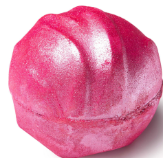
シंकピンク (バスボム)

昔ながらのグラマーさが感じれるバスボムです。柑橘系のネロリオイル、フローラルな香りを放つラベンダーオイルをブレンド。さらに甘さを出すためにバニラをプラスした、忘れられない心を捉える砂糖のように甘い香りです。お風呂に解き放せば、シルバーのきらめきで縁取られた様々な濃さのピンク色の渦が誕生します。