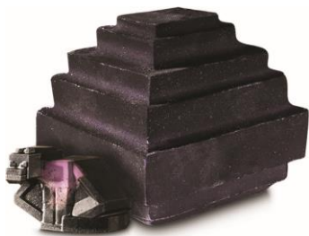
エンダードラゴンのスポンエッグ ¥3,000 (税込) / 個 (バスボム)

ジャイアントサイズのこのバスボムがあれば、バスタブに飛び込んで、キラキラ輝くバスタイムの新しいディメンションを冒険したくなるでしょう。バスボムを溶かすと中から、エンダードラゴン(ソープ)が出現します。バスボムは、一度に全部お湯に溶かすもよし、数回に分けて使うもよし！楽しみ方はあなた次第です。おいしいローズジャムをイメージしたローズとレモンの香りが広がります。