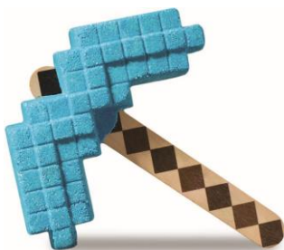
ダイヤモンドのツルハシ ¥2,000 (税込) / 個 (バブルバー)

ジャイアントサイズのこのバスボムがあれば、バスタブに飛び込んで、キラキラ輝くバスタイムの新しいディメンションを冒険したくなるでしょう。バスボムを溶かすと中から、エンダードラゴン(ソープ)が出現します。バスボムは、一度に全部お湯に溶かすもよし、数回に分けて使うもよし！楽しみ方はあなた次第です。おいしいローズジャムをイメージしたローズとレモンの香りが広がります。