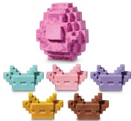
ウーパールーパーのスポンエッグ ¥2,500 (税込) / 個 (バスボム)

ツルハシを構え、振り回してふわふわな泡を立てたら、パチヨリとシナモンリーフをブレンドした落ち着いた香りが広がります。ダイヤがなくなるまで繰り返し使える泡風呂が作れるリユーズバブルタイプのバブルバーです。