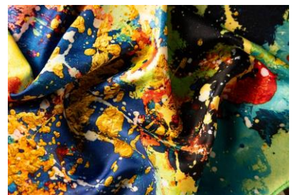
『アウター スペース ノットラップ』 ARTHOUSE Unlimitedのデザイナー David Bellがデザイン