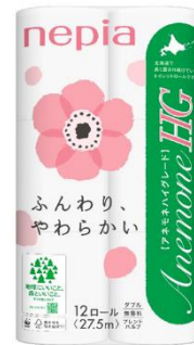
リニューアルデザイン