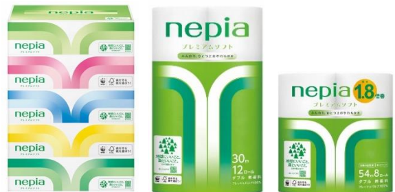
リニューアルデザイン（プレミアムソフトシリーズ）