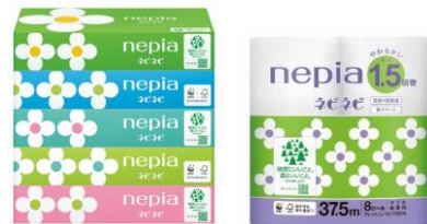
リニューアルデザイン（ネピネピシリーズ）