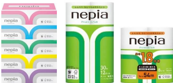
現行品（プレミアムソフトシリーズ）

若葉をイメージして創られたネピアラインに大胆にグラデーションを使い、上質なイメージやみずみずしい透明感を表現したパッケージデザインに変更。かわいいお花のデザインとカラフルさが特長のネピネピは、メリハリのある濃い色味に変更しました。さらに、商品名「プレミアムソフト」を英語表記からカタカナ表記へと変更し、可読性を高めました。