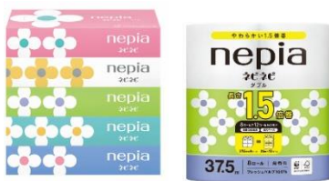
現行品（ネピネピシリーズ）