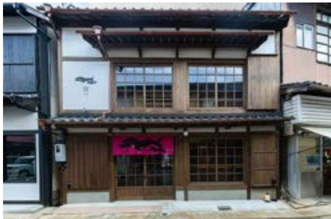
甚六朝市食堂 外観

施設では「甚六朝市食堂」や「甚六果実店」など、呼子ならではの食を楽しむことができます。観光だけでなく、食を通して港町の魅力を感じられるのも特徴です。