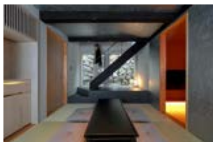
【浦田別邸】一棟貸しの客室

また、古民家を活用した別邸も3棟用意しており、港町の雰囲気により深く感じられる滞在スタイルも選べます。