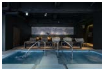
イケス水風呂と内気浴スペース