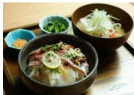
甚六朝市食堂 漁師町の朝市ごはん