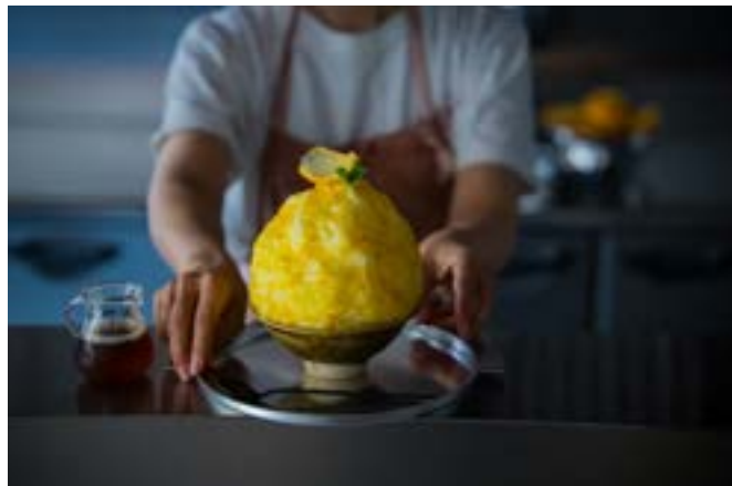
甚六果実店 甘夏かき氷