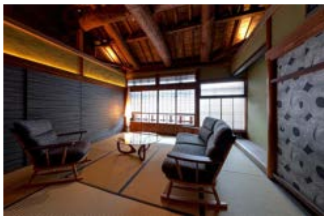
【熊本別邸】甚六果実店 2階の客室