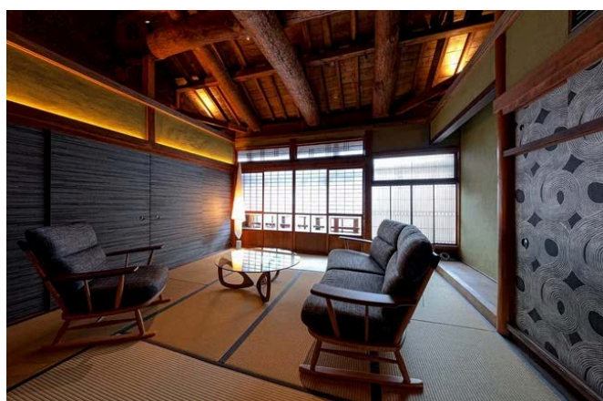
【熊本別邸】甚六果実店 2階の客室