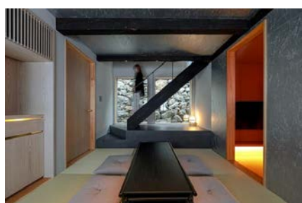
【浦田別邸】一棟貸しの客室

また、古民家を活用した別邸も3棟用意しており、港町の雰囲気により深く感じられる滞在スタイルも選べます。