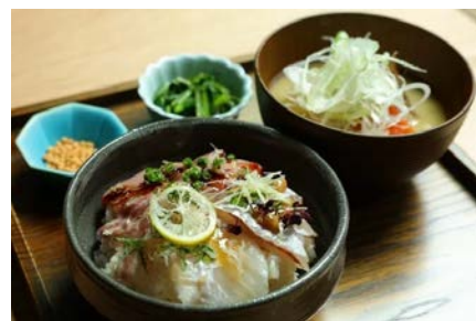
甚六朝市食堂 漁師町の朝市ごはん