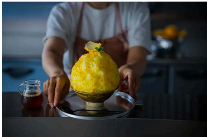
甚六果実店 甘夏かき氷