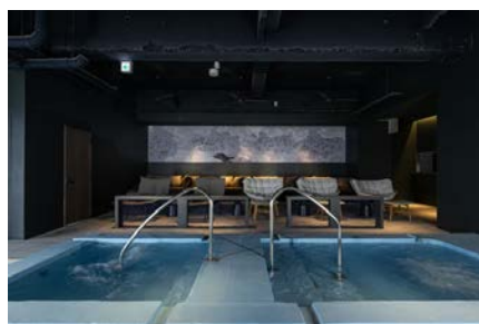
イケス水風呂と内気浴スペース