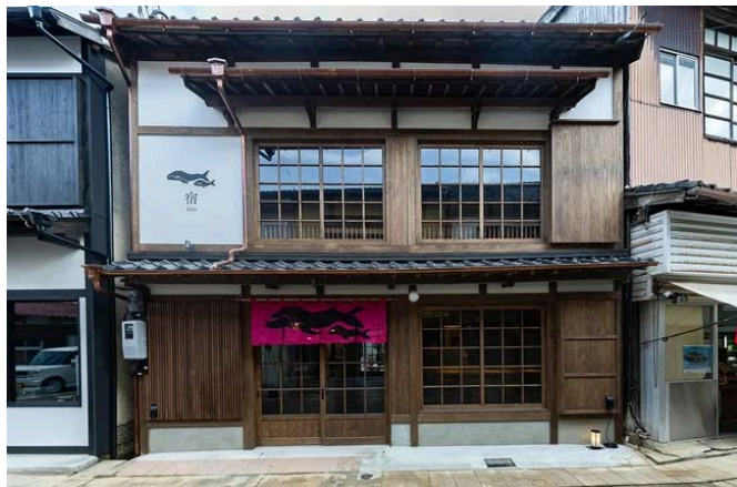
甚六朝市食堂 外観

施設では「甚六朝市食堂」や「甚六果実店」など、呼子ならではの食を楽しむことができます。観光だけでなく、食を通して港町の魅力を感じられるのも特徴です。