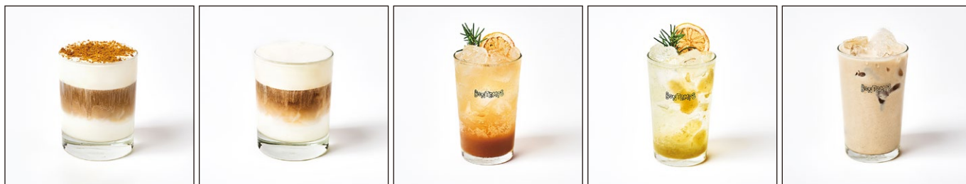
ボンタンクリームコーヒー