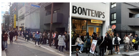
大阪「アメリカ村本店」のオープン時の様子。

昨年12月の大阪「アメリカ村本店」オープン初日には50m超えの大行列ができ、最大3時間待ちとなるその人気ぶりは在阪TV局すべてに取材され、雑誌やその他メディアでも多数掲載いただくなど、BONTEMPS旋風を巻き起こしました。さらにSNS上でも映えドーナツやおしゃれな店内での写真をアップする方が続出しています。