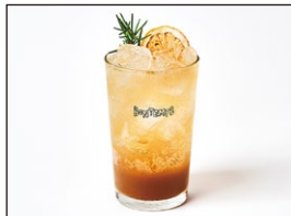
アールグレイレモネード