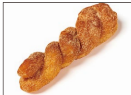
シナモンシュガー