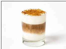
ボンタンクリームコーヒー