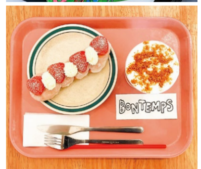
ドーナツは期間限定を含め20種以上ラインナップ。