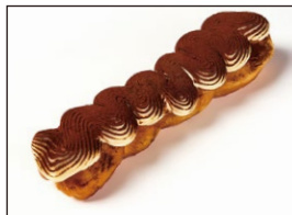
ティラミスクリーム