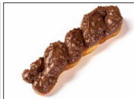
アーモンドチョコ