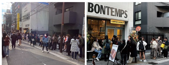
大阪「アメリカ村本店」のオープン時の様子。

昨年12月の大阪「アメリカ村本店」オープン初日には50m超えの大行列ができ、最大3時間待ちとなるその人気ぶりは在阪TV局すべてに取材され、雑誌やその他メディアでも多数掲載いただくなど、BONTEMPS旋風を巻き起こしました。さらにSNS上でも映えドーナツやおしゃれな店内での写真をアップする方が続出しています。