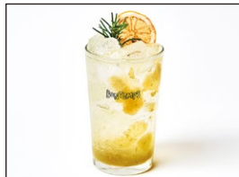
シャインマスカットエイド