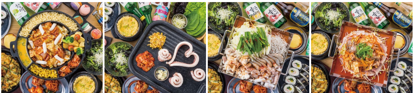
チーズタッカルビ