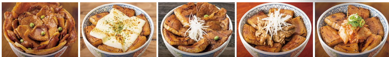
<左より>豚ロース丼<メガ> / 炙りチーズ豚バラ丼<並> / ハーフ&ハーフ丼<並> / 豚バラMIX丼<並> / キムチ豚バラ丼<並>