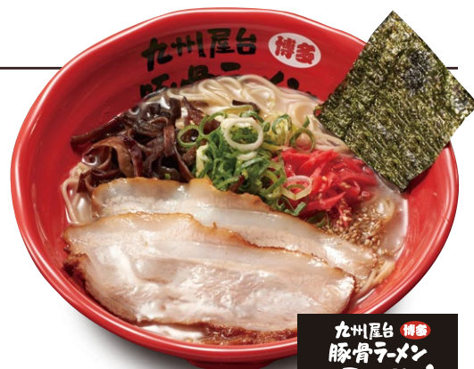
ふくやま「とんこつラーメン」

またデリバリーやテイクアウトも強化した店舗で、ご自宅や会社などお好きな場所をご利用いただけます。