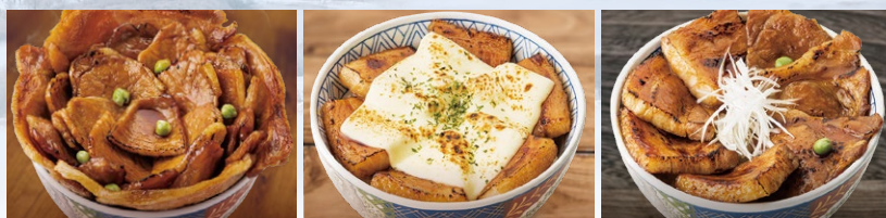
〈左より〉豚ロース丼(メガ) / 炙りチーズ豚バラ丼(並) / ハーフ&ハーフ丼(並)

北海道 帯広名物の風味をそのままに、豪快に焼きあげ、豚の旨味を凝縮した究極の一杯。秘伝のタレが食欲をそそる、一枚一枚丁寧に焼かれたお肉は一口食べれば香ばしさがお口いっぱいひろがります。コロナ禍で旅行に行きづらい昨今、当店なら北海道を感じていただけます。