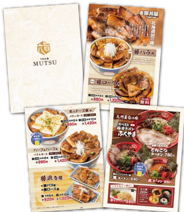
うまみ処 MUSTU メニュー例