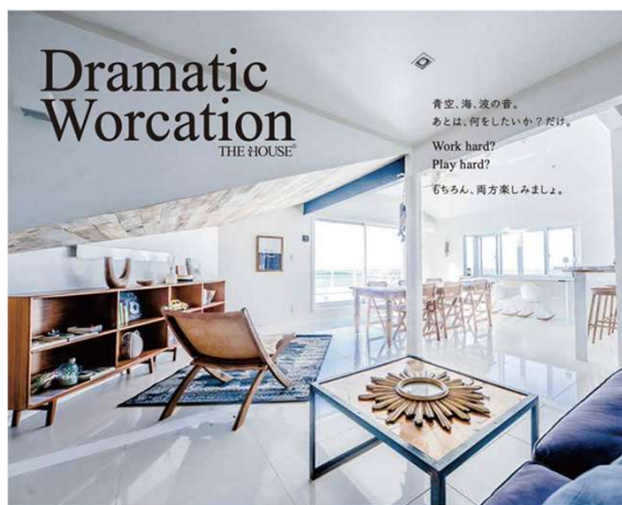
<THE HOUSE on the beach “Worcation Lounge” >

神奈川県葉山にあるプライベートレンタル邸宅“THE HOUSE”（運営：株式会社THE HOUSE 本社所在地：三浦郡葉山町堀内）は、2022年3月1日（火）に『THE HOUSE on the beach “Worcation Lounge”』をオープンいたします。プライベートな利用はもちろん、企業の福利厚生として会社・部署単位でのご利用も可能です。