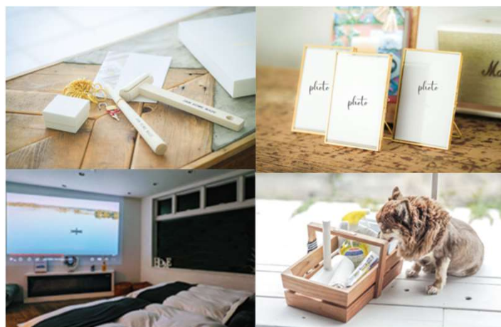
<2021年に実施した『THE NEW LUXURY』 プロジェクトイメージ>

THE HOUSEは2021年7月より、新しい贅沢”を提供する『THE NEW LUXURY』プロジェクトをスタートいたしました。THE HOUSEは創業当初より『贅沢という価値を変えていく - The NEW LUXURY -』というコンセプトをもとに、多種多様な価値観が増えている今、スペック主義とは異なる、新しい贅沢という概念の捉え方にチャレンジしてまいりました。『THE NEW LUXURY』プロジェクトはそんな我々の信念を形にし皆様に共有していくためのプロジェクトです。2021年には、プロジェクトの一環として世界に一つだけの指輪をTHE HOUSEで作るTHE HOUSE noble ring planの他、THE HOUSE Framed Anniversary等7つのサービス&オプションを提供開始いたしました。