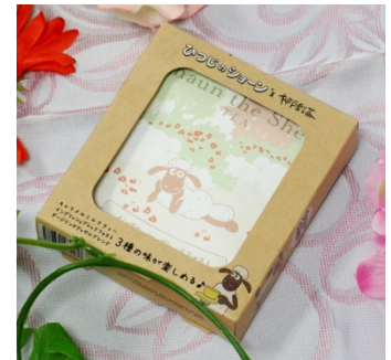
ひつじのショーン紅茶

イングリッシュブレックファースト、キャラメルミルクティ、ダーズリン&アッサムの3種の味を楽しむことができ、神戸紅茶株式会社の紅茶鑑定士が「ひつじのショーン」の世界のイメージに合わせてブレンドしました。各の紅茶のパッケージには、ショーンと牧場の仲間たちのほんわかとした日常が描かれており、じっくり眺めて&飲んで二度ほっこりできてしまう紅茶セットです。自分へのご褒美や甘いお菓子に添えてホワイトデーのお返しやプチギフトにもおすすめです。