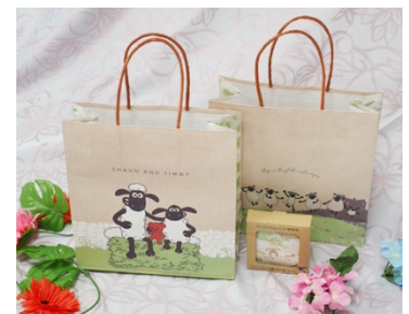
ひつじのショーン紙袋