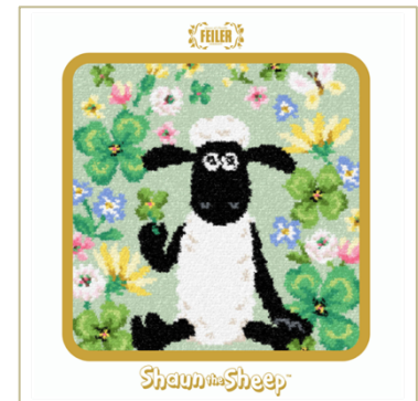
FEILER ひつじのショーン ハンカチ SHAUN THE SHEEP AND SHAUN'S IMAGE ARE ™AARDMAN ANIMATIONS LTD. 2023

ジュエリーカミネでは、池田理代子プロダクションとのライセンス契約のもと、コラボ商品として『ジュエリー絵画® ベルサイユのぼら シリーズ』、『ベルサイユのぼらカレー』、『ベルサイユのぼら 紅茶』などを販売しています。さらに、手塚プロダクションとのライセンス契約のもと、コラボ商品として『ジュエリー絵画® 手塚治虫シリーズ』、『手塚治虫キャラクターサイダー』、『手塚治虫キャラクターカレー』、『手塚治虫キャラクター紅茶』、『リボンの騎士紅茶』、『ブラック・ジャック珈琲』などを販売しています。さらに 2023 年 4 月には、英国が誇る人気キャラクターを起用した『FEILER ひつじのショーン ハンカチ』と『FEILER ウォレスとグルミット ハンカチ』の 2 種を販売しています。