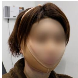
脂肪吸引の場合 圧迫固定