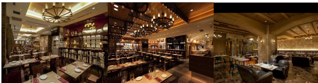
◇東京スカイツリータウン・ソラマチ店