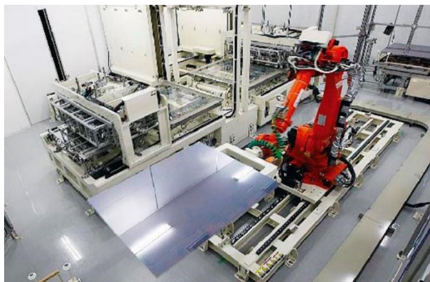
太陽光パネルを内製化し価格を抑えて販売