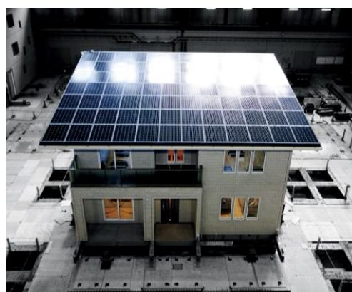
太陽光パネル搭載住宅での実大耐震実験