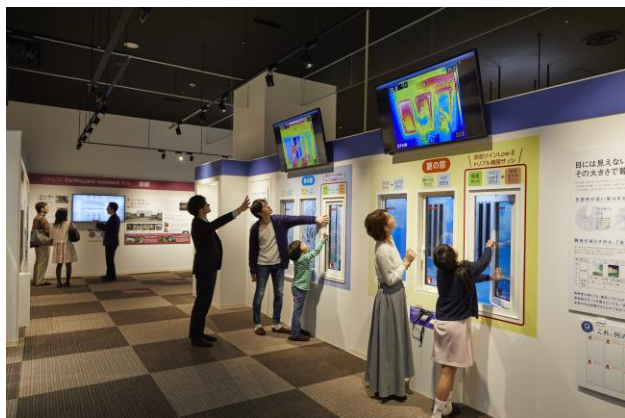
「住まいの体験会」にて窓の断熱性能の比較

（イベント情報： https://ichijo.jp/guide/event/ ）