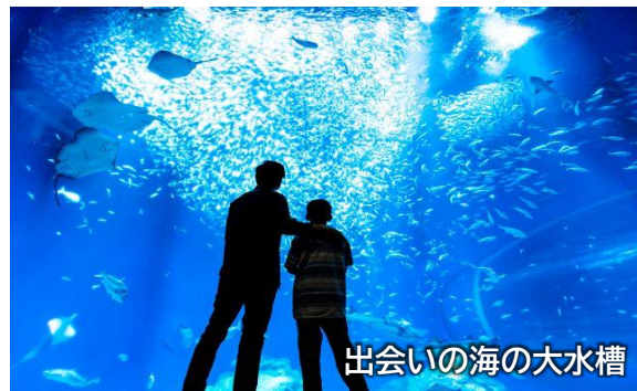
出会いの海の大水槽

来館当日 : 「ラーケーション特割申込書」を窓口へ提出およびラーケーションカード等を提示の上、チケットを購入。