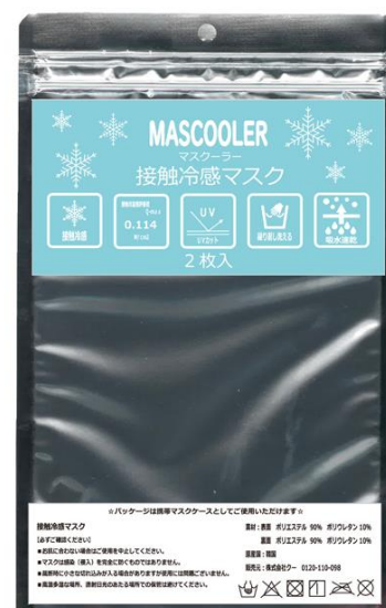
※パッケージデザインはイメージです。