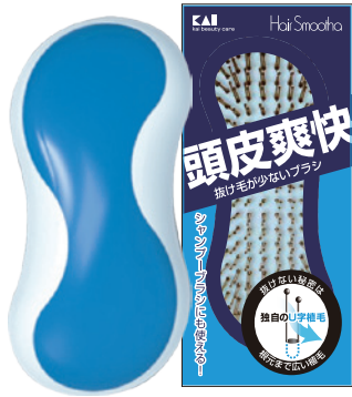
セラミックブルー