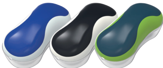
セラミックブルー モノトーン ライムグリーン