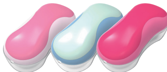
パステルピンク アイスブルー チェリーピンク