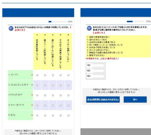
既存アンケート画面