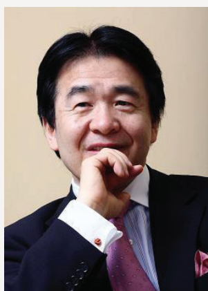
竹中平蔵 経済学者 慶應義塾大学名誉教授