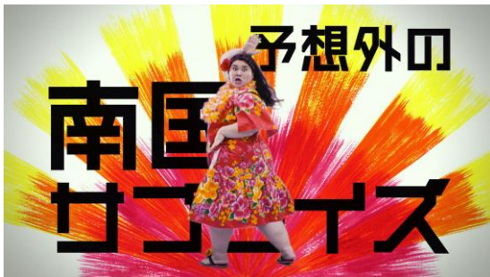
▲どんなサプライズが待っているか、ワクワクな気分に。キャッチーなフレーズをテンポ良く歌います。