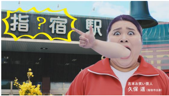
▲顔から腕が現れ「指宿」を指す。