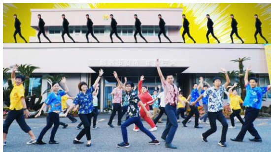
▲フィナーレ是指宿市役所前で、職員の方が軽快な踊りを披露。上段の黒い人影にも注目です。