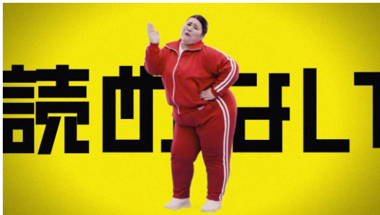
▲「読めない」を洗い表情で表現。