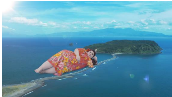
▲わがままボディを活かした演出。