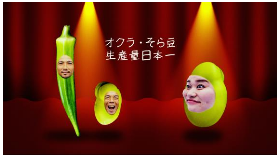
▲オクラ・そら豆生産量一位についてもコミカルに表現。