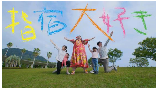
▲移住者の方もご家族で出演。