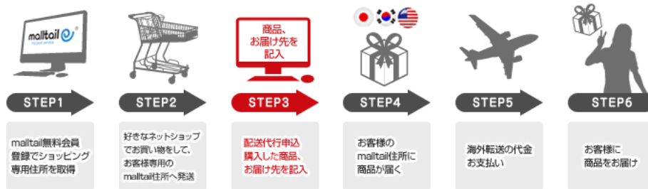
海外発送代行（海外転送）サービス概要

また日本のeコマース（ネットショップ）事業者様については通常のオペレーションを全く変更することなく海外ユーザーへの商品販売が可能になり、海外への販売需要があるにも関わらず国際配送への対応できていない事業者様の海外販売のサポートも可能となります。