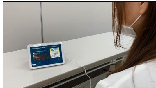
*「トゥデイズイングリッシュ」学習の様子（動画） （動画 URL https://youtu.be/wU9kEsjUjRo ）