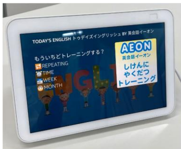
*画面は Echo Show 8

「トゥデイズイングリッシュ」は、ご自宅で気軽にAlexaと対話しながら、イーオン英会話教室レッスン時のような英単語トレーニングを、無料でご利用いただける新コンテンツです。「Amazon Alexa」のマルチリンガルモード※2を活用した新コンテンツで、今年2月に提供を開始した「イングリッシュタイム」に続く第2弾となります。