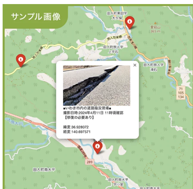
道路の不具合を地図上に可視化

「現場地図」は、CALINTの技術とオープンストリートマップを組み合わせて作成されるHTML形式の吹き出し付き地図です。このサービスにより、より効果的な現場管理と位置情報の共有が可能になり、以下の特長があります。