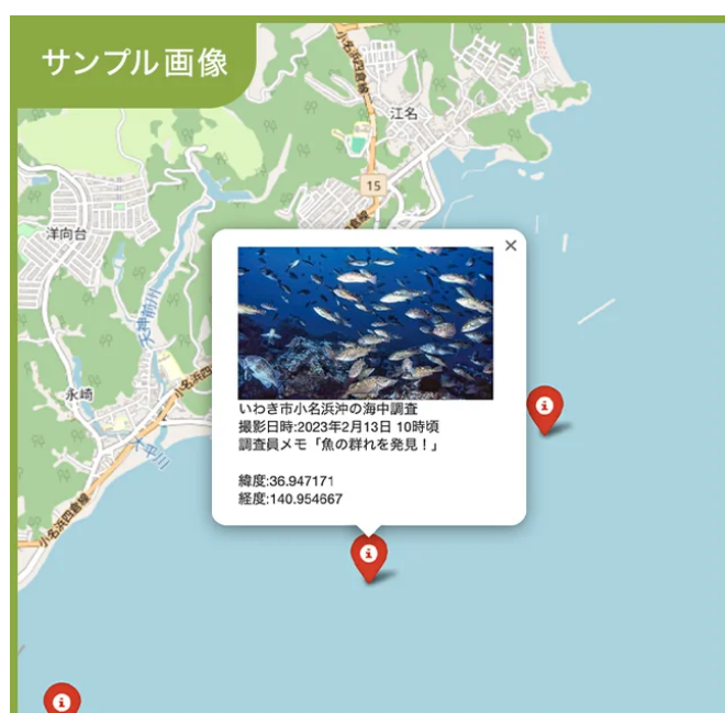
海中の状況を確認し、場所と情報を可視化