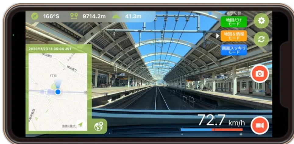
電車での利用例（CALINTスマホアプリ）

スマホ1台で地図付き動画を簡単に撮影でき、連続した位置情報を記録できるアプリ https://moegi.jp/calint/app/