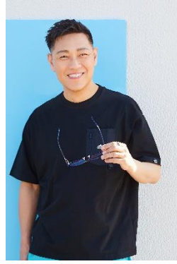
みんなのパパさん @minpapa1002