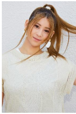
づえるちゃんさん @vellvell_0816