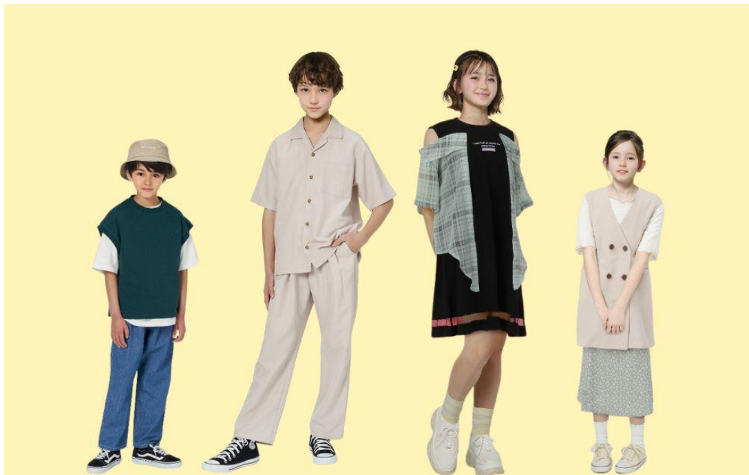
130cmの男の子 150cmの男の子 150cmの女の子 130cmの女の子

キッズAIモデルは男女あわせて4名おり、130cmの男の子、150cmの男の子、130cmの女の子、150cmの女の子を起用します。MENS、WOMENSでのAIモデルの起用を検討してまいります。