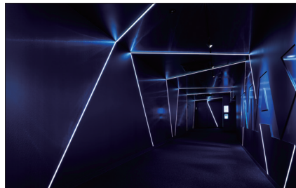
109シネマズグランベリーパーク 設計:株式会社フィールドフォー・デザインオフィス 施工:株式会社 東映建工

「Luci」に次ぐ、第2のブランドとしてドイツのLEDメーカー「LED LINEAR」を販売しています。「LED LINEAR」商品は屋外での使用に適した高い機能性を有しています。両ブランド併用により、屋内外のライン照明を1社で対応し、多様化していくデザイン表現に貢献いたします。