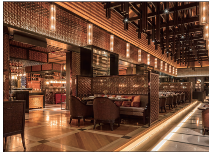
Ritz Carlton Langkawi 設計:株式会社 ストリックランド 照明設計:株式会社 ライトモメント 写真:Zoom