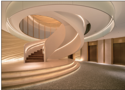
インターコンチネンタル横浜Pier 8ホテル 建築設計:株式会社梓設計 インテリアデザイン:株式会社日建スペースデザイン 照明設計:株式会社ワークテクト 施工:五洋建設株式会社

狭小LED間接照明ブランド「Luci」は、実用的・安全・確かなものづくりと顧客サービスをベースに、創立以来15年間、国内外に100,000件以上の納品実績を築き上げてきました。さらに内装建築分野から得たノウハウを、電源システムや機能照明、IoT分野に応用し、新規分野での事業拡大を遂行しています。