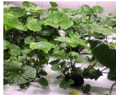
定植した『真妻わさび』