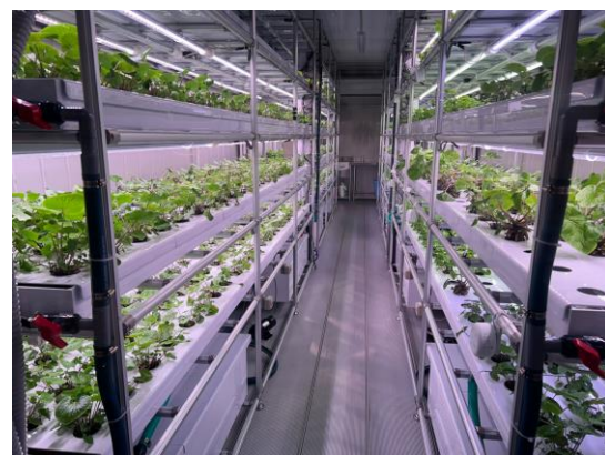
モジュール室内の様子

栽培に必要な知識やノウハウについては、モジュール内に設置したカメラ、センサー情報を元にNEXTAGEが現状分析を行い、的確な栽培作業をお知らせしながら“わさびを栽培”するもので、デジタルテクノロジーを活用し、誰でも、どこでもわさびを栽培することが可能になるという画期的なわさび栽培モジュールになります。