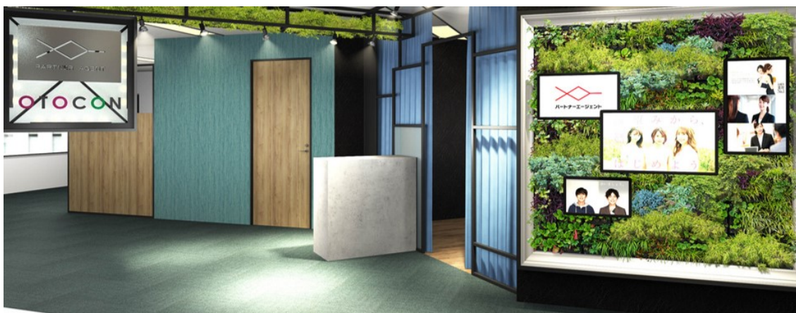
<パートナーエージェント接客ブース>

<パートナーエージェント仙台店(OTOCON 婚活イベントラウンジ併設)イメージ>