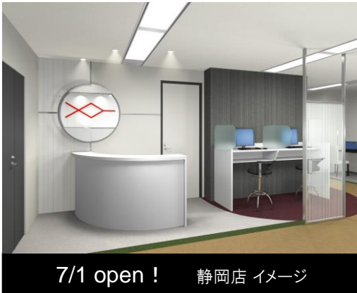
7/1 open! 静岡店 イメージ

コンシェルジュによる婚活支援サービスを展開する株式会社パートナーエージェント(本社:東京都品川区、代表取締役:佐藤茂、以下パートナーエージェント)は、2013年7月1日、静岡駅前に新店舗をオープンいたします。