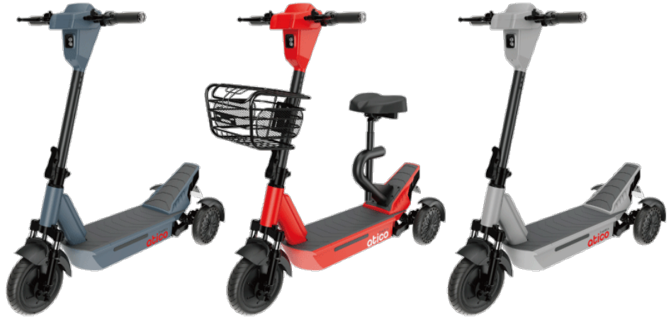
スモーキーブルー