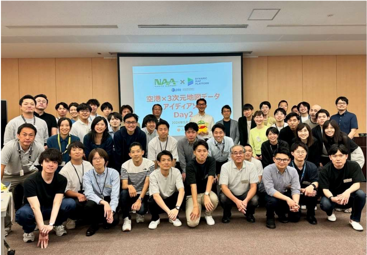
「空港×3次元地図データアイデアソン」参加者の皆様

このアイデアソンは5月27日(月)、28日(火)の2日間、NAAの会議室で行われ、NAA、DBJ、当社に加え、全国の空港会社や商社などから、33名が参加しました。