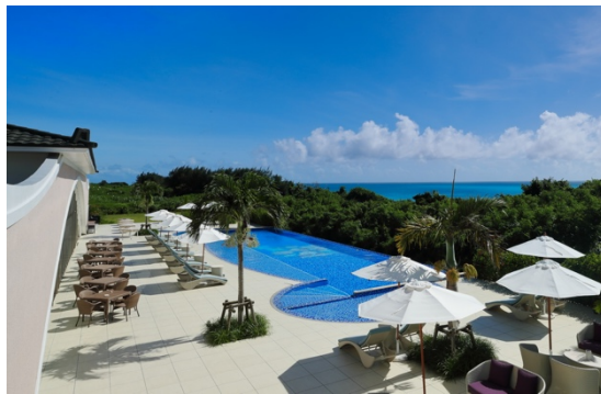
シーウッドホテル『メインプール』