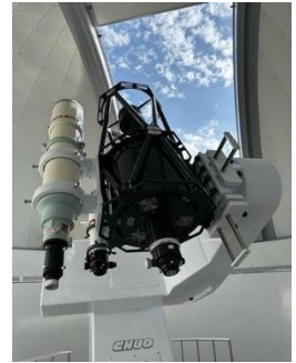
※2026年3月に設置された望遠鏡の実物画像です。

天文台ドームには複数の天体望遠鏡を設置しています。その夜に来間島で観ることの出来る様々な天体を観測することが可能です。望遠鏡に導入した天体は、併設するLEDプラネタリウムドームに投影され、まるで宇宙に飛び出したかのような臨場感と没入感を体感出来ます。