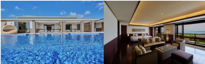
▲左から ビラハウスの「PRESIDENTIAL」、首里ハウス「JUNIOR SUITE」

客室は、全室スイート仕様の独立型「ビラハウス」とホテル棟「首里ハウス」の2タイプ、全169室をご用意。ビラハウスは、プライベートプール付き102棟、ジャグジー付き5棟を備え、オリエンタルな雰囲気の中でプライベートな滞在をお楽しみいただけます。首里ハウスは、デラックスルーム60室とスイートルーム2室を有し、ゆったりとした空間で快適なホテルステイを提供します。